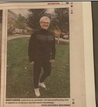
Arrangerer støttekonsert for demensaksjonen